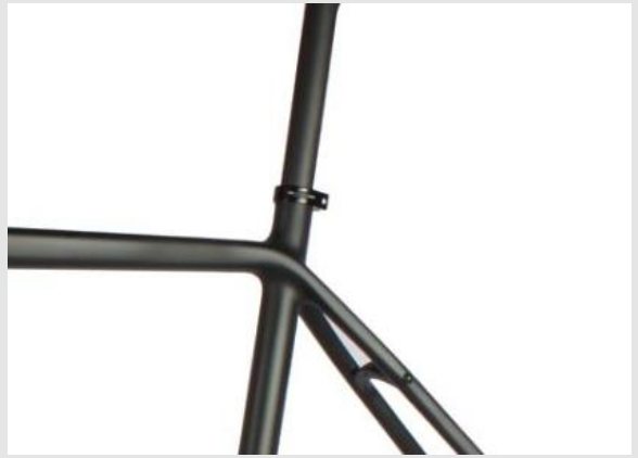
Sattelstütze Durchmesser 27,2mm