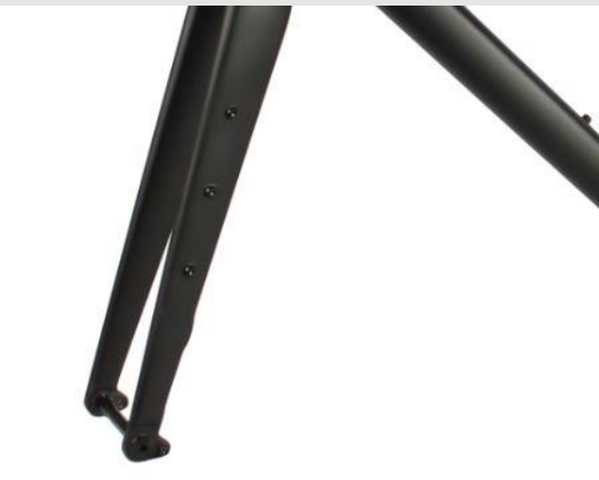
Carbon Gabel Einbaubreite 100mm Steckachse 12mm