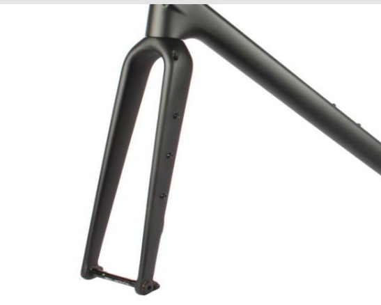
Maximale Radgröße 700x50C