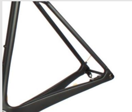
Hinterradaufnahme Einbaubreite 142mm Steckachse 12mm