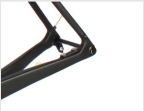
Scheibenbremse (Flat Mount) Brems Scheibendurchmesser 140mm oder 160mm