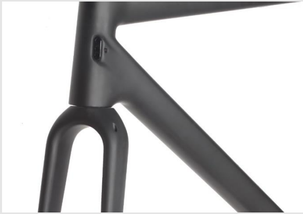
UD Carbon- Gewebe